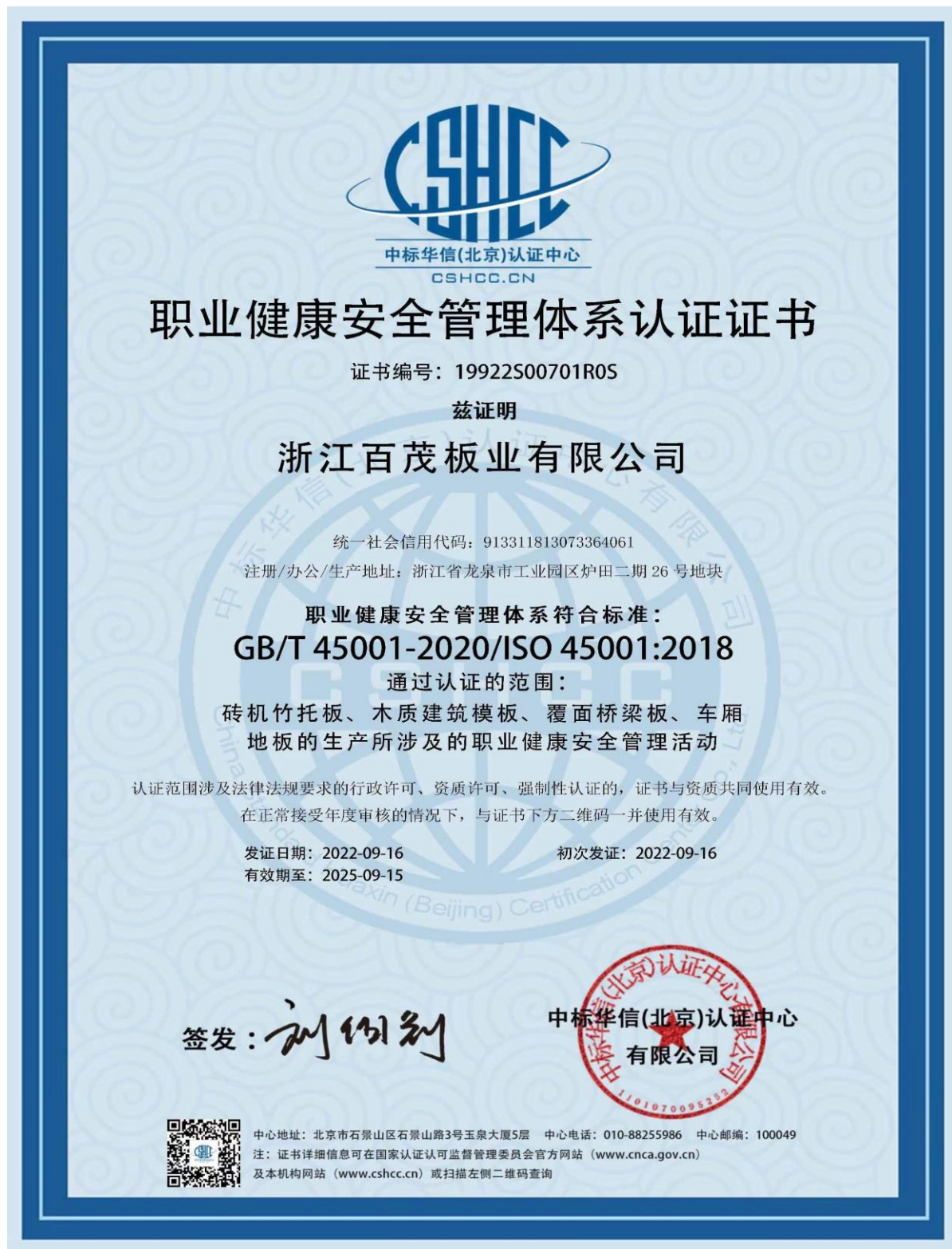
图表 8 职业健康安全管理体系证书