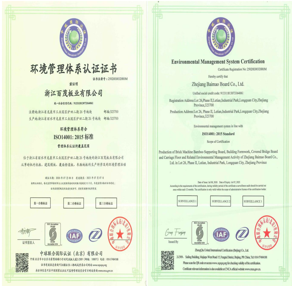
图表 7 环境管理体系证书